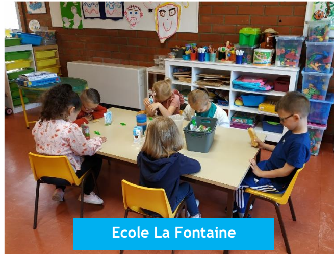
Ecole La Fontaine