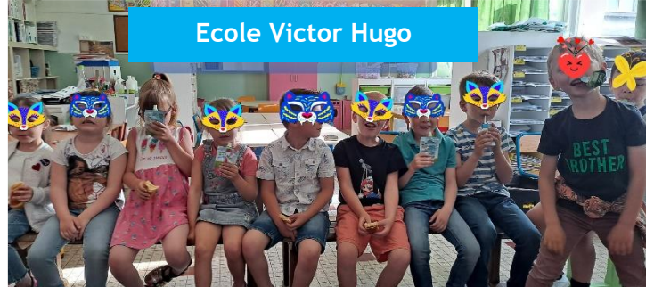
Ecole Victor Hugo

En répondant aux besoins nutritionnels de l'élève, la prise du petit déjeuner favorise la concentration, l'attention et la bonne humeur, facteurs de réussite scolaire. Il est également un temps privilégié de partage et de convivialité.