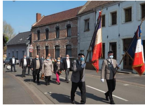
1 er mai Fête du Travail