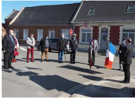
25 avril Journée de la Déportation