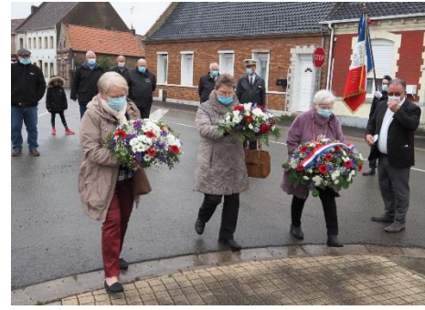
8 mai Armistice 1945