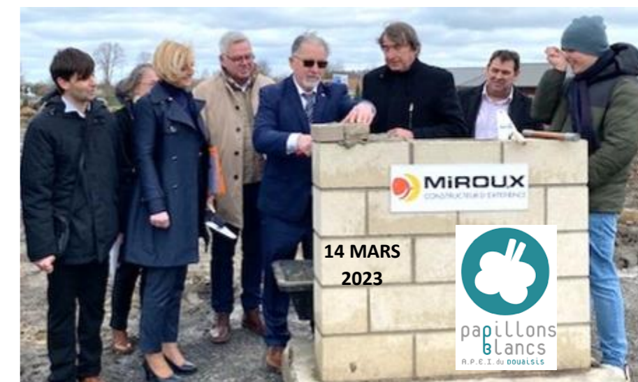
Pose de la 1 ère pierre en présence de M. Le Maire, des Elus de l'Etat, de la Région, du Département et des représentants de l'APEI

🕒 Rendez-vous en 2024 pour inaugurer ces nouveaux locaux !